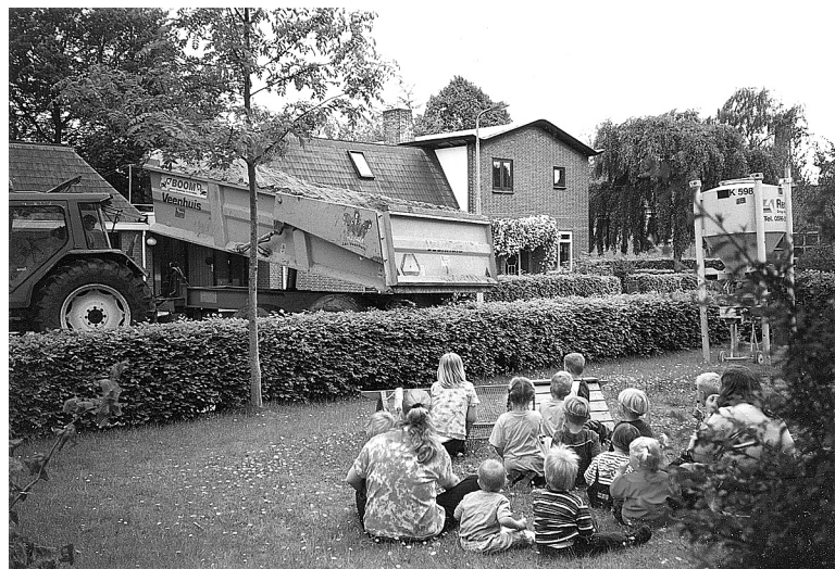
Wordt ons speellokaal een zandkasteel? De start van de verbouwing.