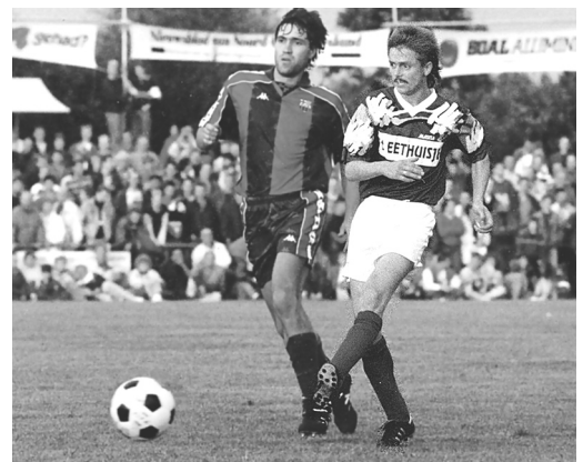
"...en dan speel je tegen ploegen als Barcelona, PSV en Ajax..."