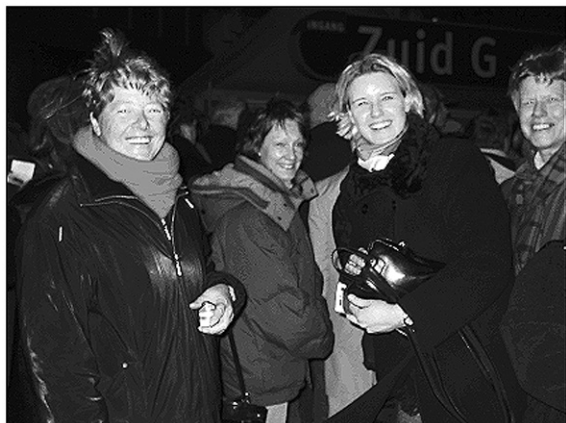
Gekiëkt door de Staatsloterij-fotograaf in de Arena

Op 1 februari, aan de vooravond van het huwelijk van de Prins van Oranje en zijn bruid Maxima Zorreguieta, was het zover, het Nationaal Huwelijksfeest in de Arena in Amsterdam. Vanuit alle gemeenten konden afvaardigingen worden gestuurd. Achtkarspelen liet gelukkig geen verstek gaan, zodat wij, negen inwoners uit Buitenpost, het feest mochten bijwonen. We wisten niet wat ons precies te wachten stond. Een klein deel van het programma was al bekend, in de bus naar de Arena kregen we het definitieve programma. Dat beloofde wat. Marco Borsato, Trijntje Oosterhuis, Ten Sharp, Van Dik Hout, geen kleine namen. Met twee bussen van Veenstra Reizen werd de hele afvaardiging uit Achtkarspelen bij de Arena afgezet. Na nog een kwartiertje lopen en het bestijgen van diverse steile trappen bereikten we onze stoelen. We hadden ons nog maar net geïnstalleerd of het spektakel barstte los. Achteraf hadden we wel wat eerder in de Arena willen zijn om nog meer