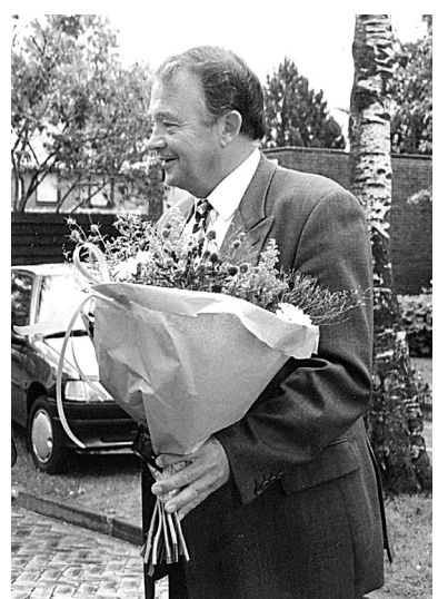
...representant van de gemeente...

duceerd moet worden. Je moet in staat zijn om in de schoenen van de andere partij te gaan staan. Dat kan hen helpen om beter te presteren. Er zijn kwesties die om een groot geduld en uithoudingsvermogen vragen. Om dit allemaal te kunnen, moet je sociaal vaardig zijn,